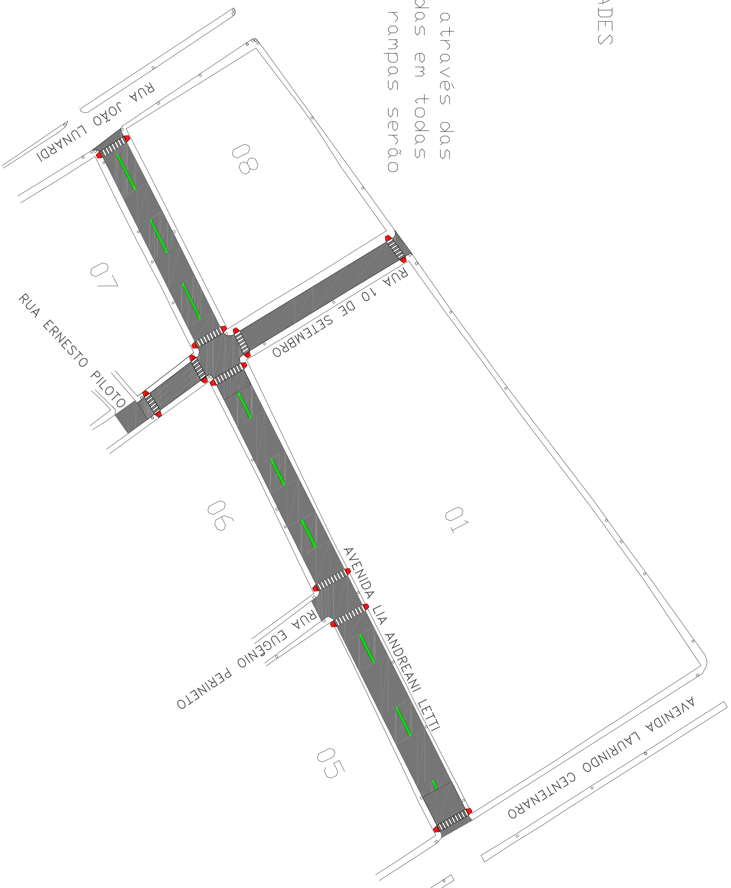
PLANTA ROTA ACESSÍVEL ESCALA 1:1.000